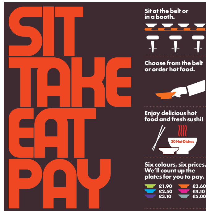
Abbildung 1: Ausschnitt aus der Speisekarte von Yo!Sushi.

Industriedesign. Die meisten Kunden haben nur eine sehr geringe Beziehung zu Japan und erwarten nicht unbedingt, japanische Elemente vorzufinden. Yo!Sushi bietet eher eine lokale (westliche) Erfahrung, die für lokale Kunden viel vertrauter ist.